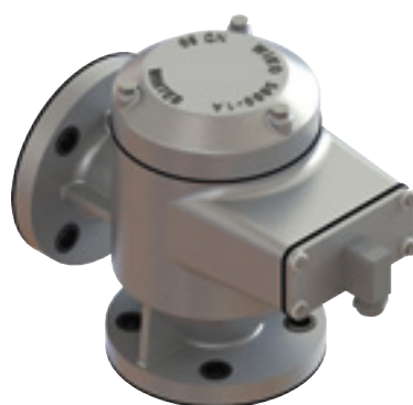
WIN5000 avec résistance chauffante sur demande