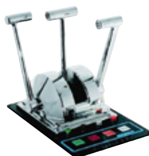
Réf. 6515 + Clavier Réf. 6510