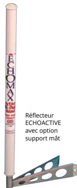
Réflecteur ECHOACTIVE avec option support mât