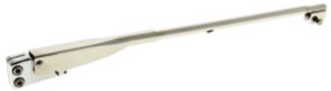
Bras pendulaire BS