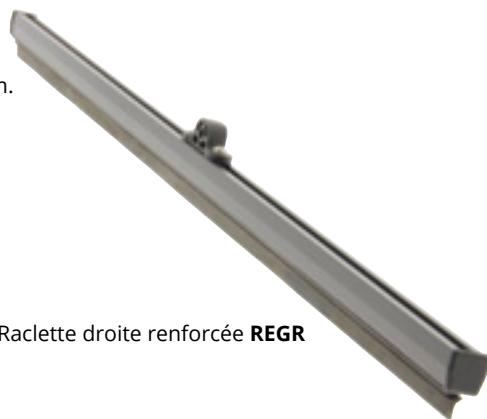
Raclette droite renforcée REGR

Droites de 500 à 1000 mm et bombées 900 et 1000 mm.