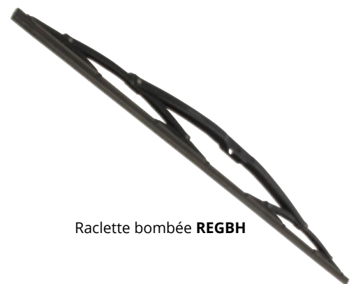
Raclette bombée REGBH