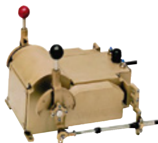
Servomoteur Réf. 6524