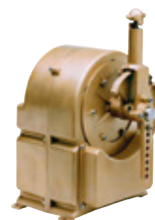
Servomoteur Réf. 6528