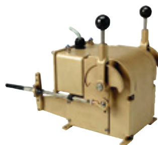
Servomoteur Réf. 6527