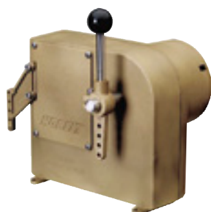
Servomoteur Réf. 6531