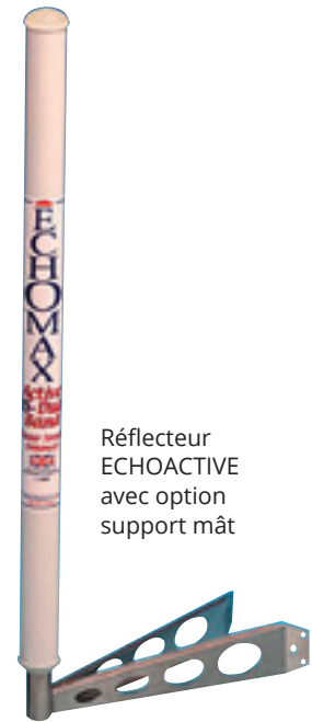
Réflecteur ECHOACTIVE avec option support mât