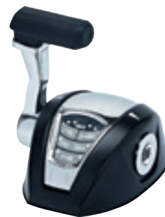
Simple levier avec Trim, Réf. 42427B