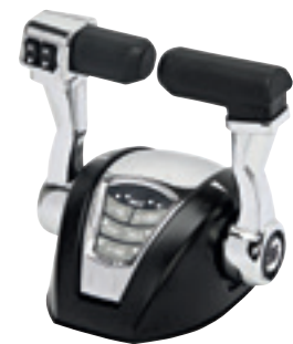
Double levier avec Trim, Réf. 42428B