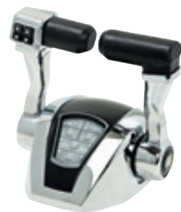
Double levier avec Trim, Réf. 42012 V