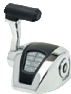
Simple levier avec Trim, Réf. 42010 R