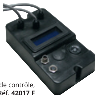
Unité de contrôle, Réf. 42017 F