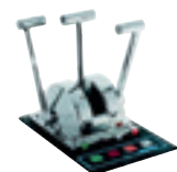
Réf. 6515 + Clavier Réf. 6510