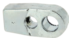
Embout à œil