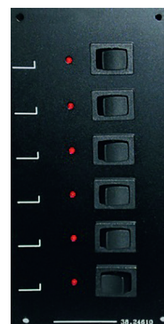
Tableau électrique à commutation