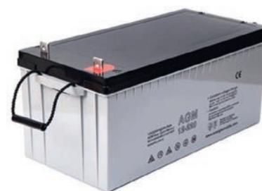
AGM12220 - AGM12320