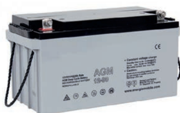
AGM1250 - AGM6370