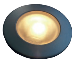
SPLED013C - SPLED013CI