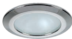
HIKARIB - HIKARIR